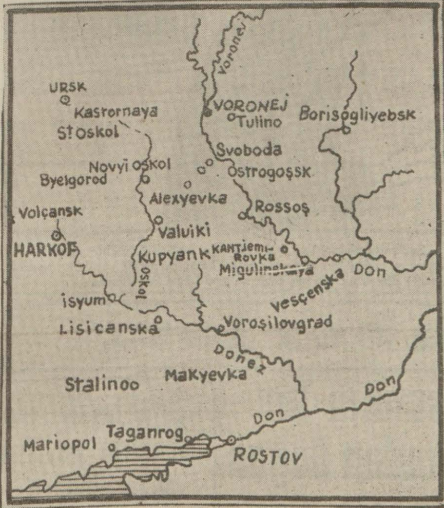
Şark cephesinde hareket sahalarını gösterir harita

Basler Nachrichten gazetesinin Berlin muhabirinin verdiği bir habere göre, kral namzedi Donjuan de Bourbon'dur.