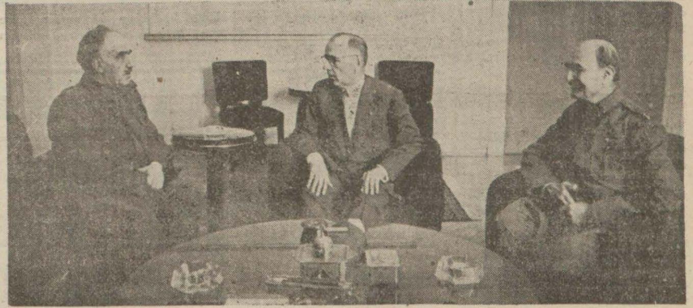
Mareşalin Başvekili ziyaretine aid intiba