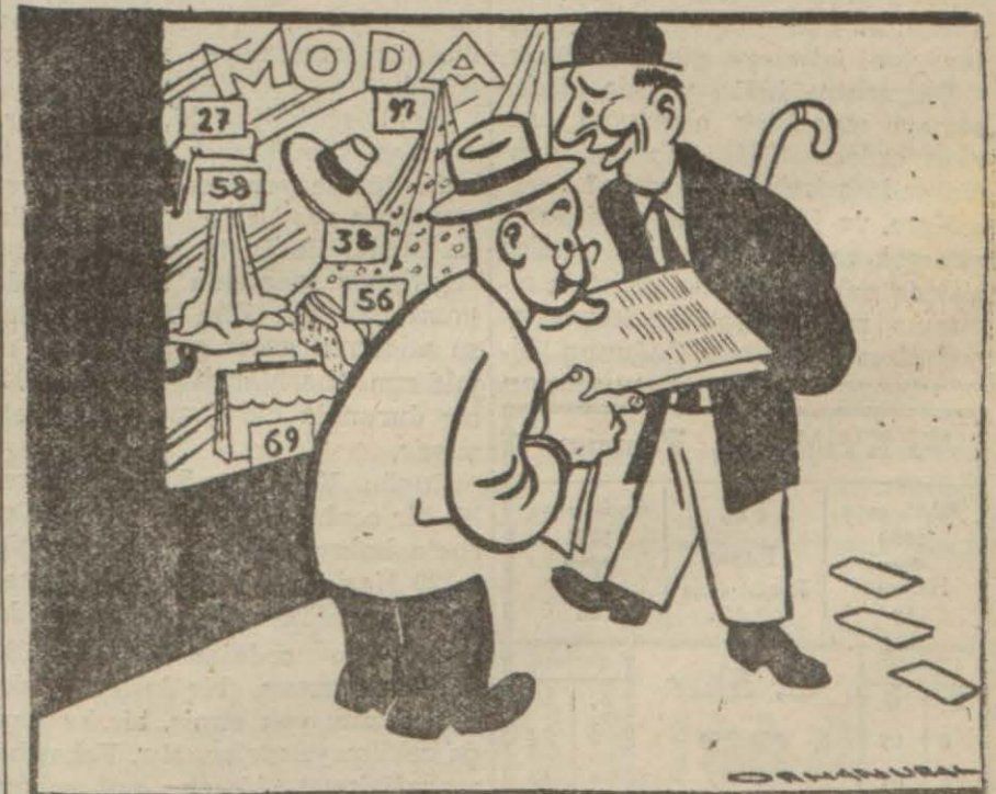
— Belediye lokanta camekânlarında yemek teşhirini ye sak etti!

Söğüt (Hususi) — Söğütün Avlamış köyünde bir ormanlık içinde bir cinayet işlenmiştir. Söğüt mîntakasında dolayan Çingene grup (Devamı 5 inci sayfada)