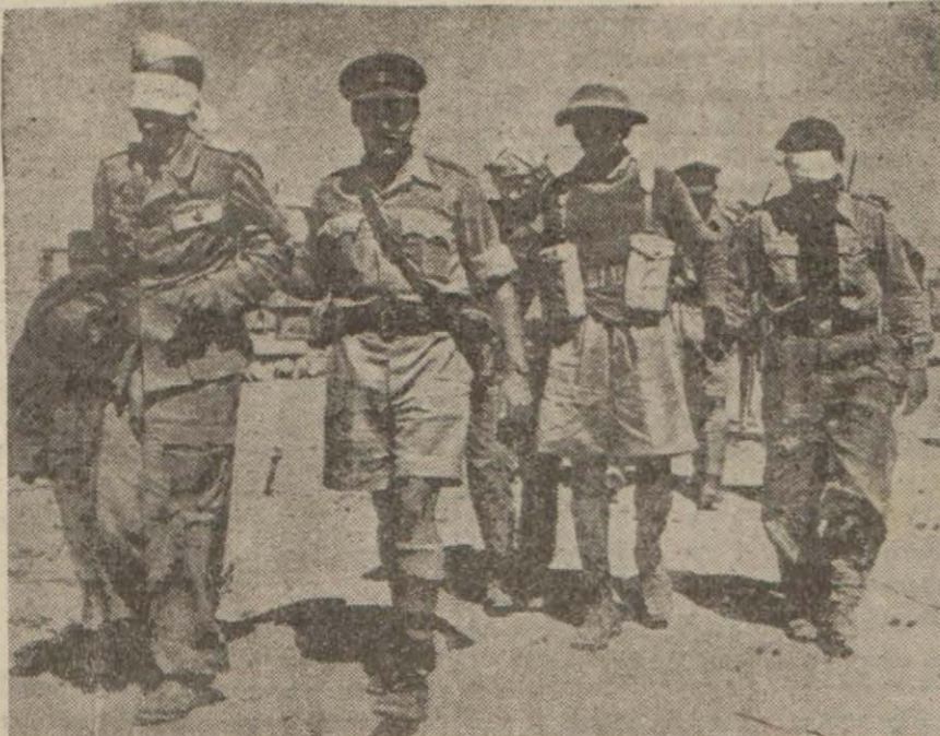
Çöldeki müdahirebeler esnasında İngilizler tarafından esir edilen Alman tayyarecileri İngilizleri başlı olarak kampa götürülüyor.

diği halde 28 Haziranda Harkof - Kursk mîntakasından başladığı büyük yamna taarruzunun ilk safhasında (Devamı 6 nci sayfada)